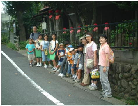
西の地藏堂（坂下地藏）前にて（加地班）