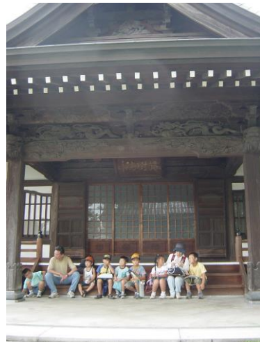
大昌寺本堂前にて（谷班）