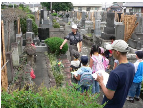
普門寺にて（鹿野班）