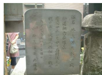
④井上源三郎のお墓