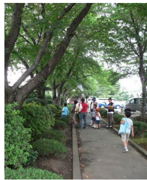
③大昌寺の参道(さんどう)でセミとり