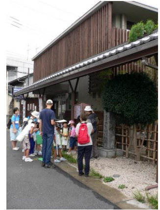
②甲州道中日野宿問屋場(といやば)・高札場跡(こうさつばあと)の石碑(日野図書館前)