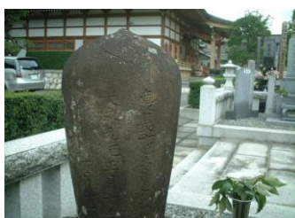
④400年も前のお坊(ぼう)さんのお墓