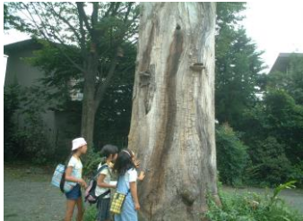
③八坂神社(やさかじんじゃ)のご神木(しんぼく)