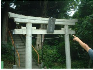
⑤飯綱権現(いづなごんげん)