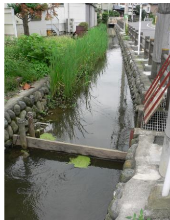
⑧日野は古くから用水路(ようすいろ)が 作られ大切(たいせつ)にされてきた