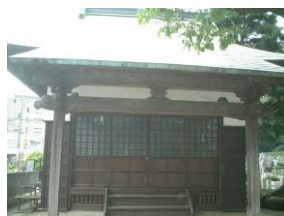
④持ち上げ観音(かんのん)こと石造馬頭(せきぞうばとう)観音がおさめられている閻魔堂(えんまどう)