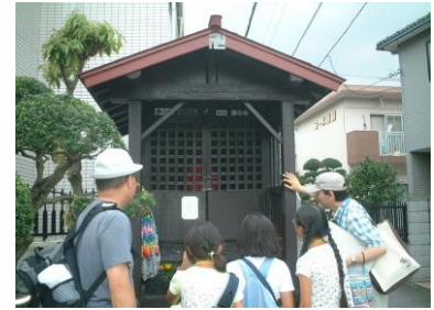
⑨目(め)の病(やまい)にごりやくがあるという「唐辛子(とうがらし)地藏」