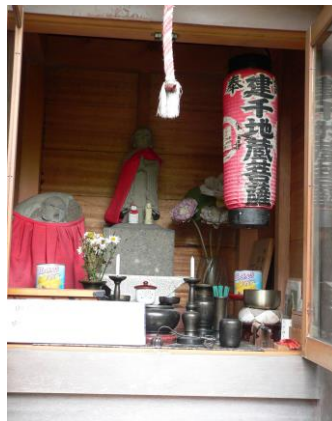
④目のお地藏さん「やんめ地藏」