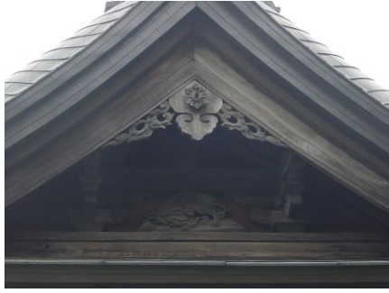
③本堂(ほんどう)の屋根(やね)に狛犬の彫り物(ほりもの)があった