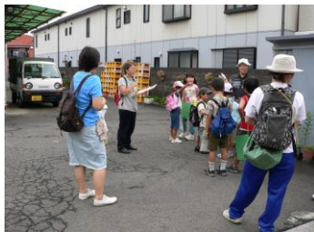
③甲州街道から裏道(うらみち)まで続(つづ)く中島酒店の庭