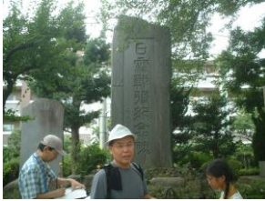
⑦矢の山公園(やのやまこうえん)の慰霊碑(いれいひ)