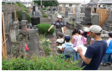
①1674(延宝2)年と銘(めい)のある日野で一番古い、普門寺(ふもんじ)のお地藏さん