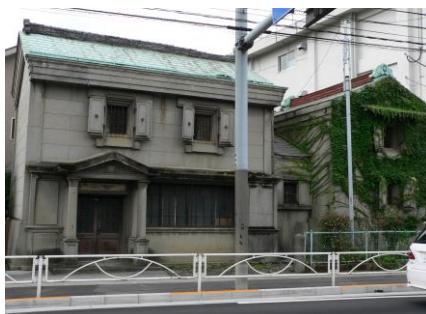
⑤昔(むかし)あった日野銀行(ぎんこう)の建物(たてもの)