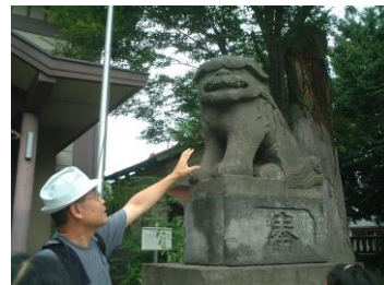
③狛犬(こまいぬ) <阿(あ)>