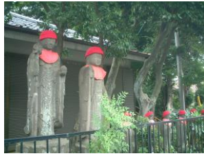
⑥西の六地藏(「西の地藏」はお堂の中)