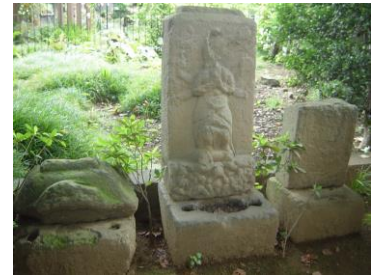
③大昌寺(だいしょうじ)の庚申塔(こうしんとう)