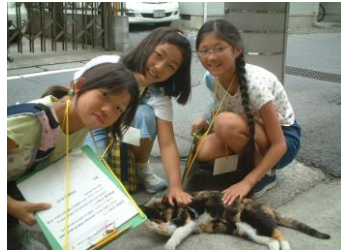
⑧きままな猫(ねこ)とのひととき