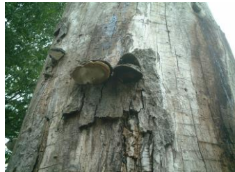
③ご神木にはえたサルノコシカケ