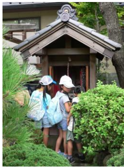
④「やんめ地藏」を祀(まつ)った社(やしろ)