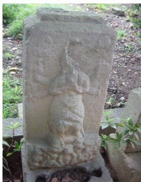
③庚申塔(こうしんとう)