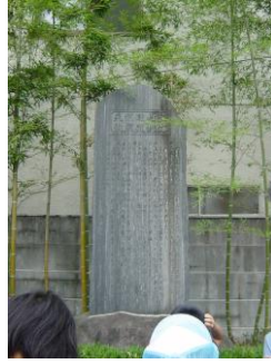
①天然理心流佐藤道場跡(てんねんりしんりゅうさとうどうじょうあと)をしるす石碑(せきひ)