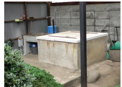
④のぞいてみると水が見えた、15mもあるふかい井戸(いど)