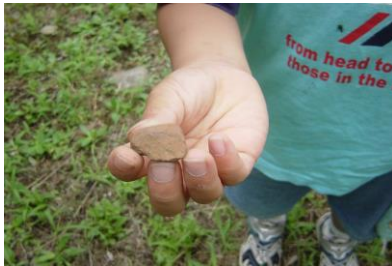
②土器(どき)のかけらを発見