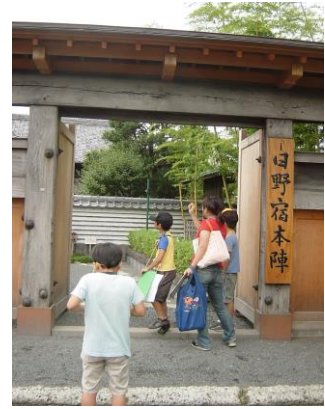
①冠木門(かぶきもん)