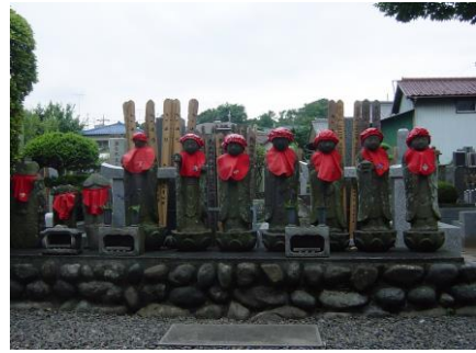
③赤いよだれかけがかわいいお地蔵さん