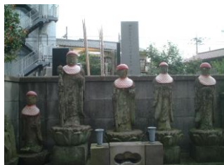
④宝泉寺(ほうせんじ)のお地藏さん