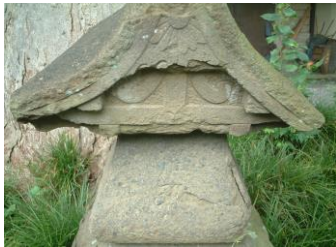
③おもしろい形(かたち)の石塔(せきとう)