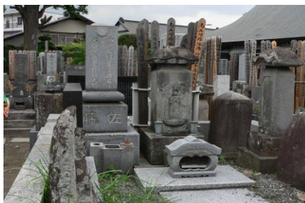
③下佐藤家(しもさとうけ)の墓