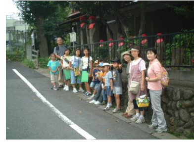
⑥お地藏さんの前で記念撮影／目の前の道は旧甲州街道