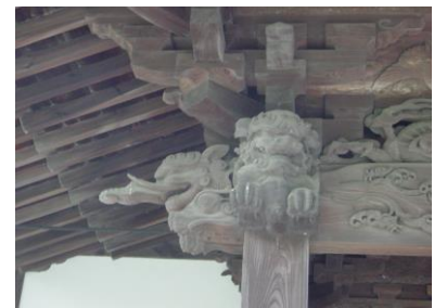
③本堂(ほんどう)の軒(のき)の木組み(きぐみ) 象(ぞう)と狛犬(こまいぬ)