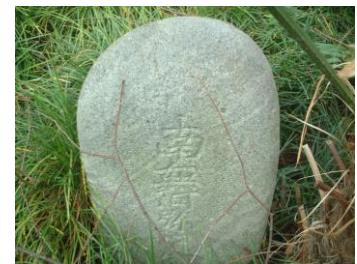
③神社の中に仏教(ぶっきょう)の石碑(せきひ)があった