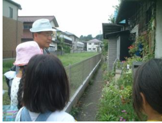
①奥(おく)にむかって細(ほそ)くて長(なが)い道