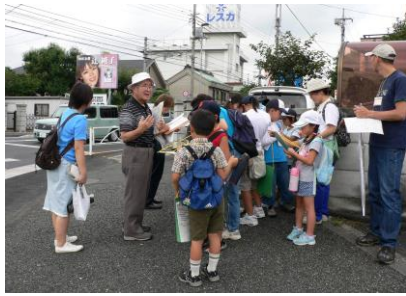
⑥日野宿の東のはずれ