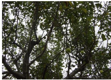
②ちいさなリンゴの実がなっていた(一小の近く)