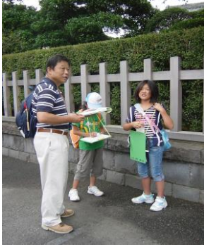
①谷班には一小の小杉校長先生も参加していただきました