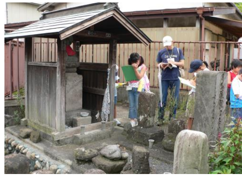
⑦日野宿「東の地蔵」福(ふく)地蔵