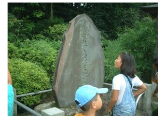
④新選組隊士(しんせんぐみたいし)井上源三郎(いのうげんざぶろう)の碑