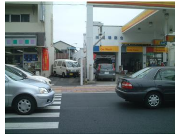
②昔ここに用水路(ようすいろ)にかかった金子橋(かねこばし)という橋があったらしい