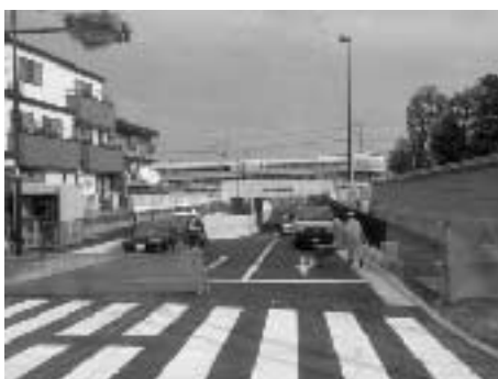
「四ッ谷立体」風景 （四ッ谷側より撮影）

三月二〇日には開通記念式典が予定されています。交通量が増えるので地元の人は要注意ですね。