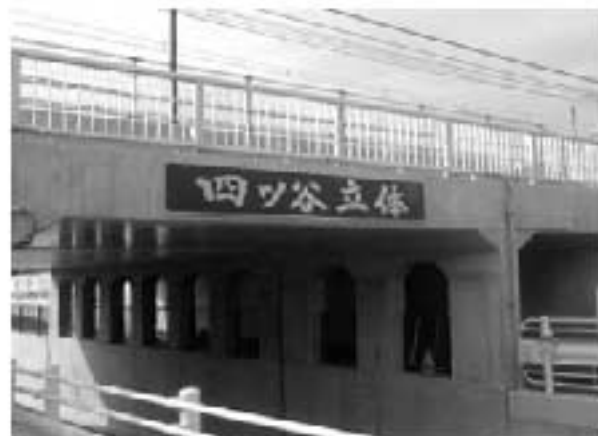
「四ッ谷立体」看板（北原側より撮影）